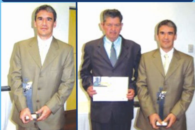
Nodia 22 de setembro o Conorte recebeu, do Comitê Setorial de Transportes Multimodais da Associação Qualidade - RS, o diploma de Distinção por Mérito, no Sistema de Avaliação - ciclo 2005